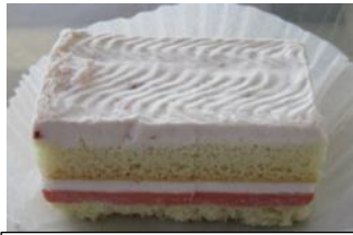
米粉と豆乳のいちごケーキ

3月の献立に「(冷)一食瀬戸内レモンゼリー(小学校のみ)」「(冷)赤魚カレー煮」「(冷)米粉と豆乳のいちごケーキ」「(冷)さつまいも大福」が初めて登場します。お楽しみに！