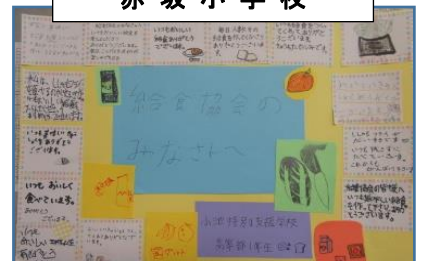
小池特別支援学校 高等部